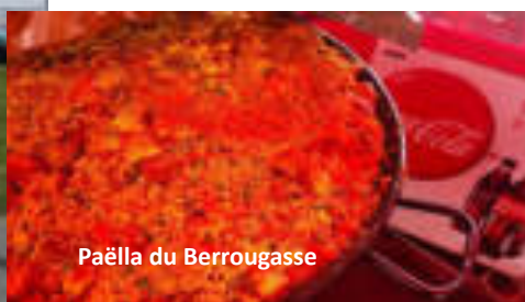
Paëlla du Berrougasse