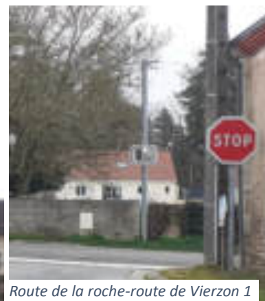
Route de la roche-route de Vierzon 1