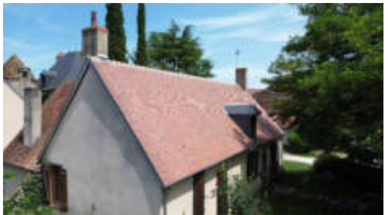
Après travaux, très beau travail réalisé par l'entreprise LAPLANTINE