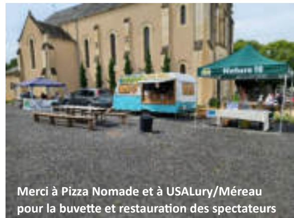
Merci à Pizza Nomade et à USALury/Méreau pour la buvette et restauration des spectateurs

L'attente est longue, mais les sièges sont confortables ; pas pour tout le monde !