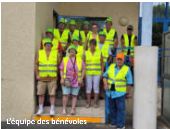
L'équipe des bénévoles

Un grand merci à toutes les bonnes volontés, l'équipe des bénévoles du jour, ayant permis que cette manifestation se déroule dans une bonne ambiance et en toute sécurité. Merci aux Amis de Lury pour le Musée en plein air, le Foyer Rural pour la réalisation des banderoles qui ornent les candélabres.