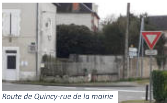
Route de Quincy-rue de la mairie