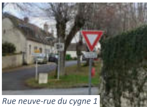
Rue neuve-rue du cygne 1